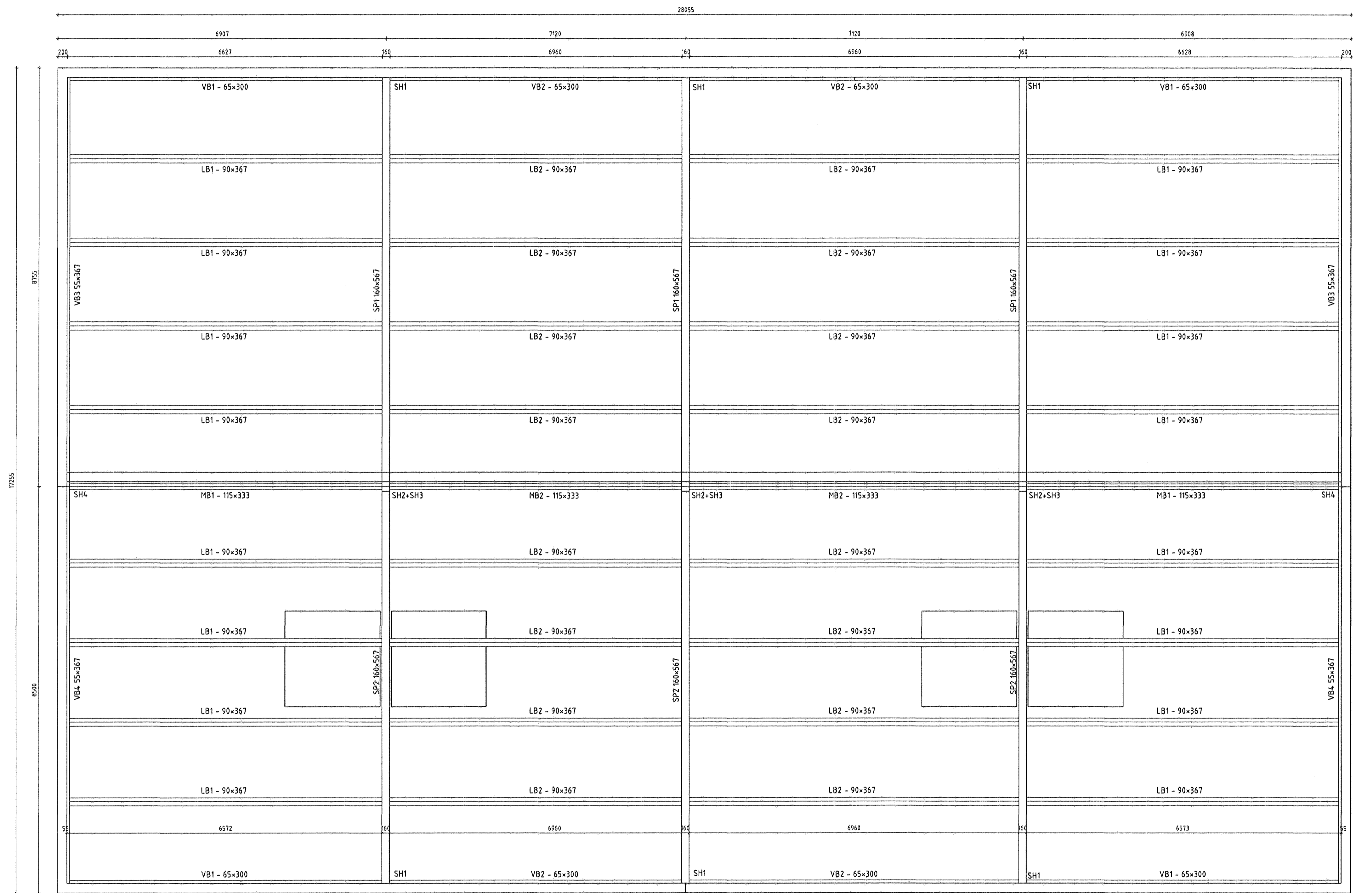
Pakmynd - Mkv.: 1:50