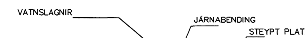
LAGNIR, SNID, 1:20

HITALAGNIR ERU AQUATHERM 16mm Í IDRÁTTARRÖRI EINGÖNGU SKAL NOTA LAGNAEFNI VIÐURKENNT AF RANNSÓKNARSTOFNUN BYGGINGARINDAÐARINS. LAGNIR, TENGIDÓSIR OG DELIGRINDUR SKULU VERA FRÁ SAMMA FRAMLEIÐANDA OG PASSA SAMAN. SETJA SKAL FESTINGAR Á LAGNIR c/c 150 cm, VIÐ BEYGJUR SKAL SETJA 3 FESTINGAR. BEYGJURRADIUS SKAL ÁVALLT VERA STÆRRI EN 5 * YTRA ÞVERMÁL PÍPNA. ÞRÝSTIÞRÓFUN Á PLASTÖGNUM SKIPTIST Í 2 LOTUR FYRRI LÖTA ER FRAMKVÆMD Í 1 KLUKKUSTUND OG ER ÞRÝSTINGUR 15 BAR FYRIR NEYSLUVATN. SENNI LOTAN ER GERÐ Í BEINU FRAMHALDI AF FYRRI LOTU OG SAMI ÞRÝSTINGUR NOTAÐUR SEINNI LÖTA SKAL STANDA Í 2 KLUKKUSTUNDIR. FYLLA SKAL ÓT PRÓFUNARBLAÐ SEM SÝNIR NIÐURSTÖÐUR PRÓFUNAR.