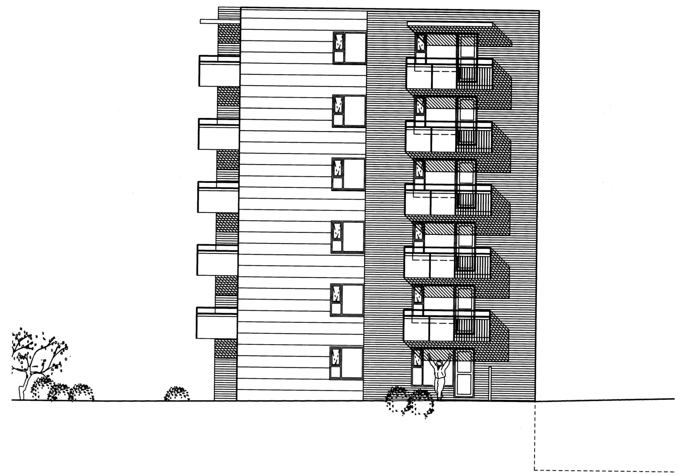
ÚTLIT 1:100 suð austur hlíð