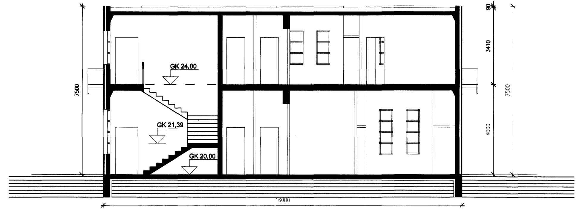
SNID 2-2 MKV. 1:100