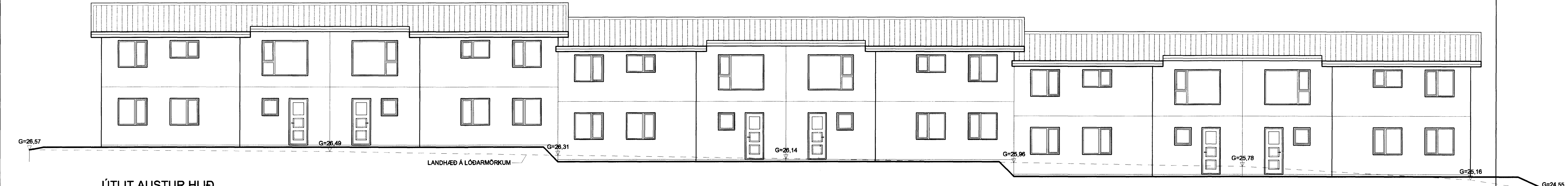
ÚTLIT AUSTUR HLIÐ