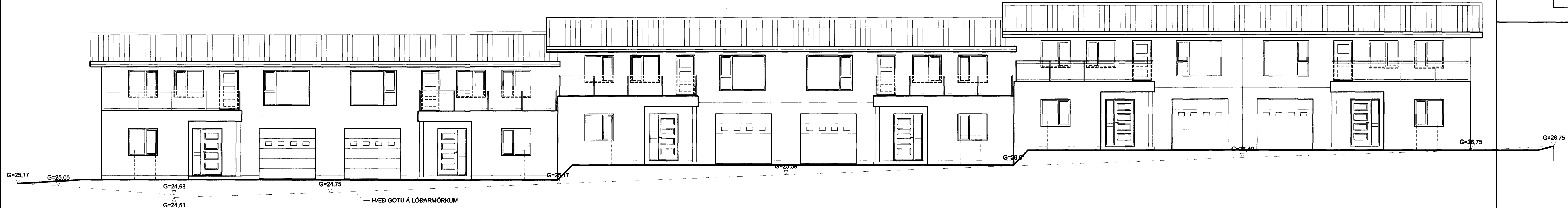
ÚTLIT VESTUR HLIÐ