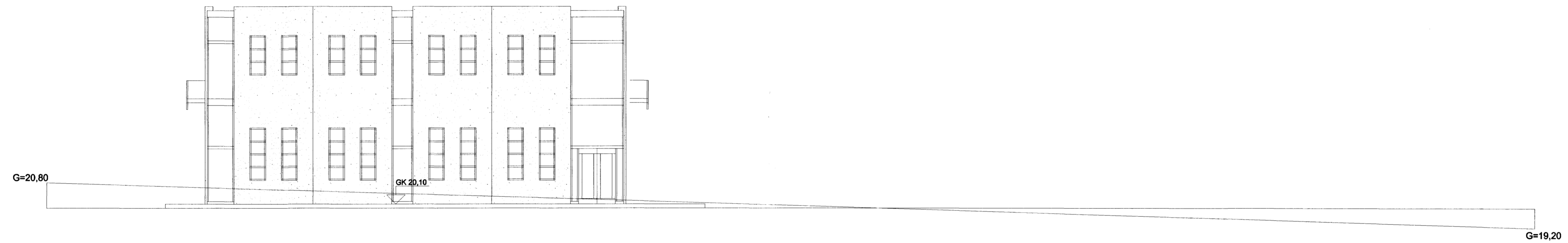
NORÐURHLIÐ MKV. 1:100