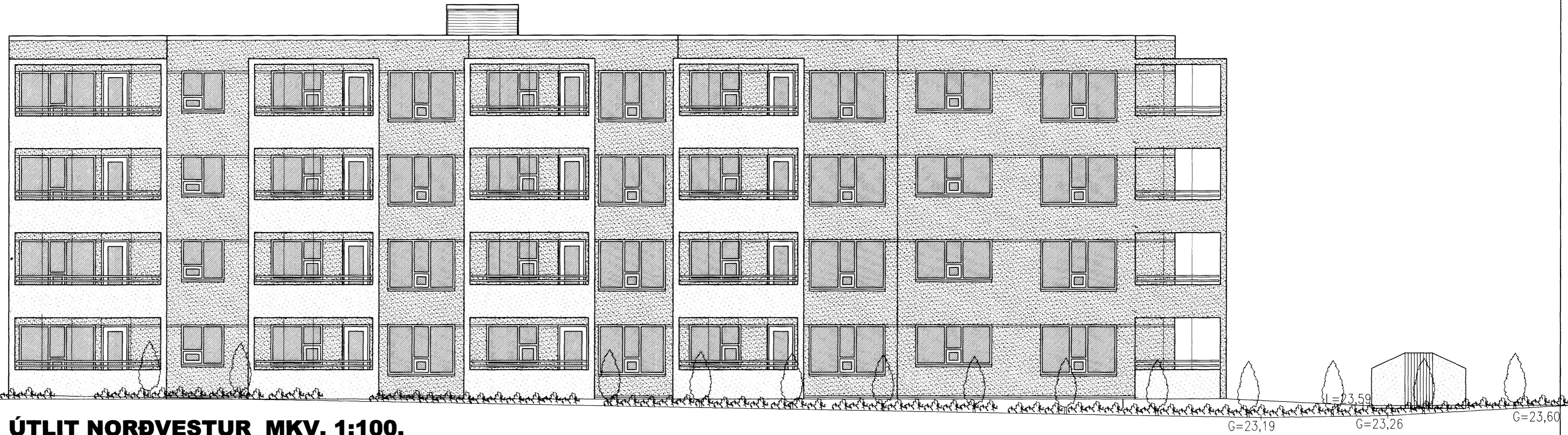
ÚTLIT NORÐVESTUR MKV. 1:100.