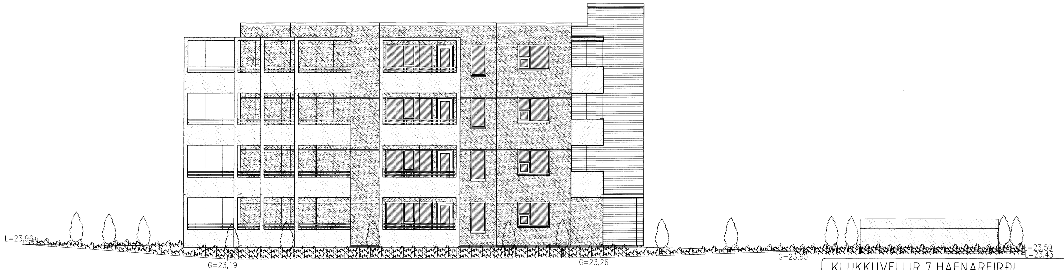
ÚTLIT SUÐVESTUR MKV. 1:100.