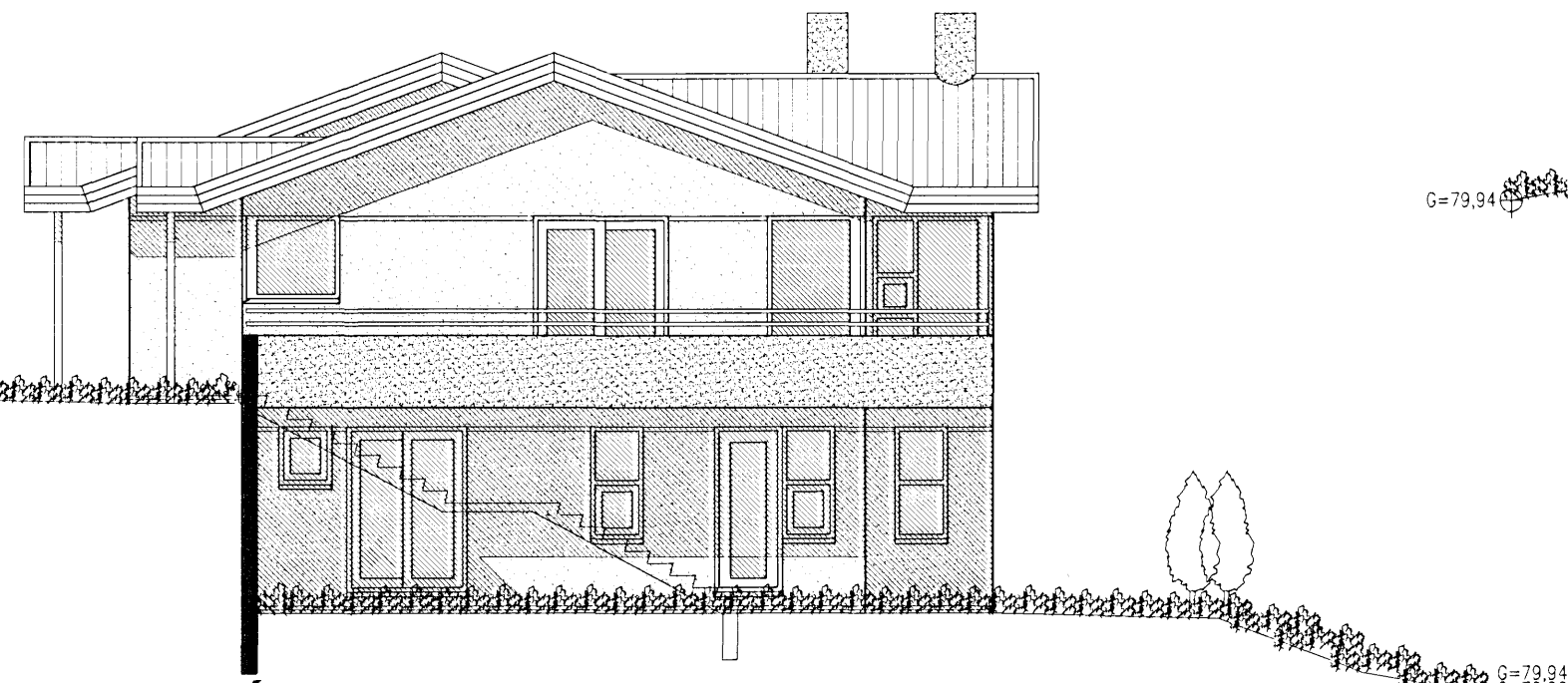
ÚTLIT SUÐUR MKV. 1:100.