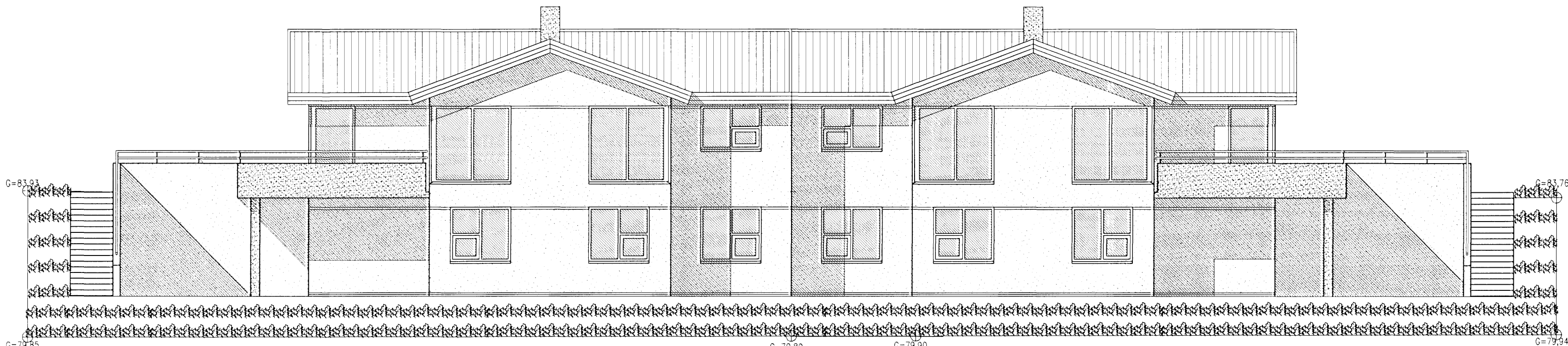
ÚTLIT AUSTUR MKV. 1:100.