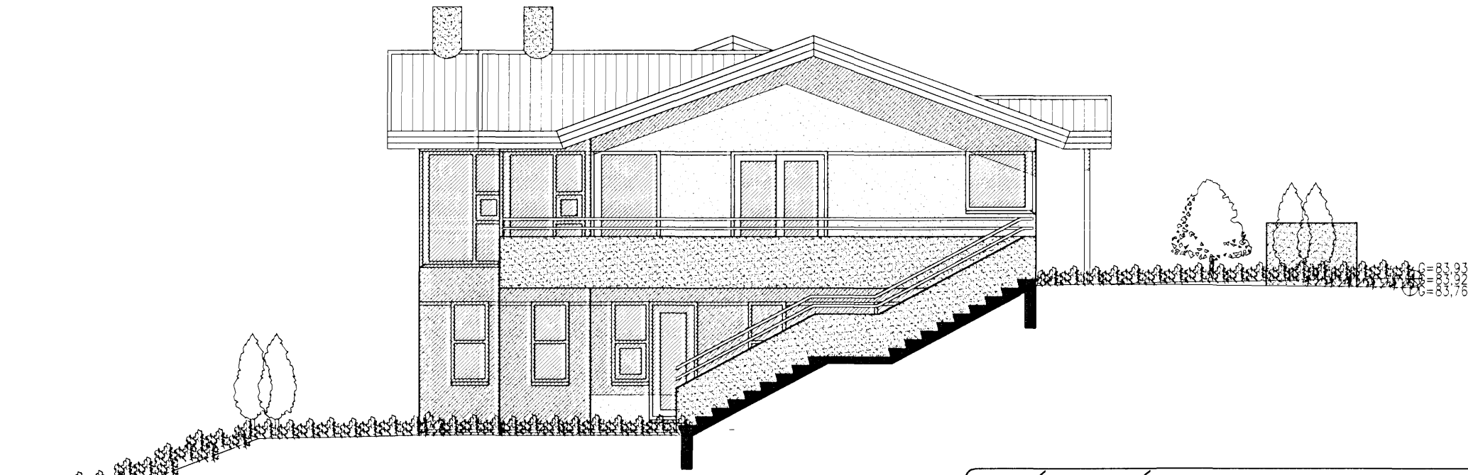
ÚTLIT NORÐUR MKV. 1:100.