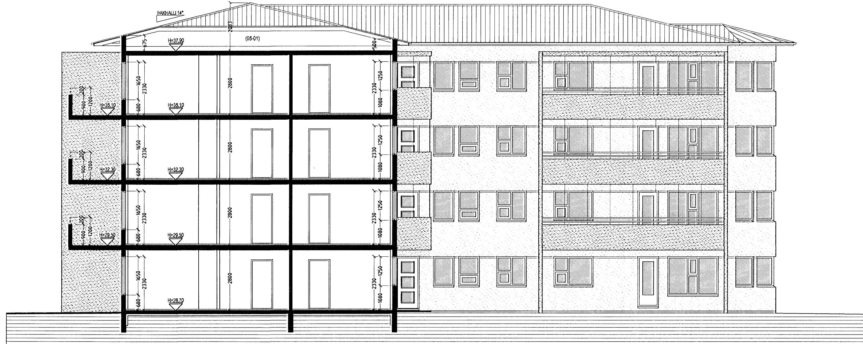
SNID A-A MKV. 1:100.