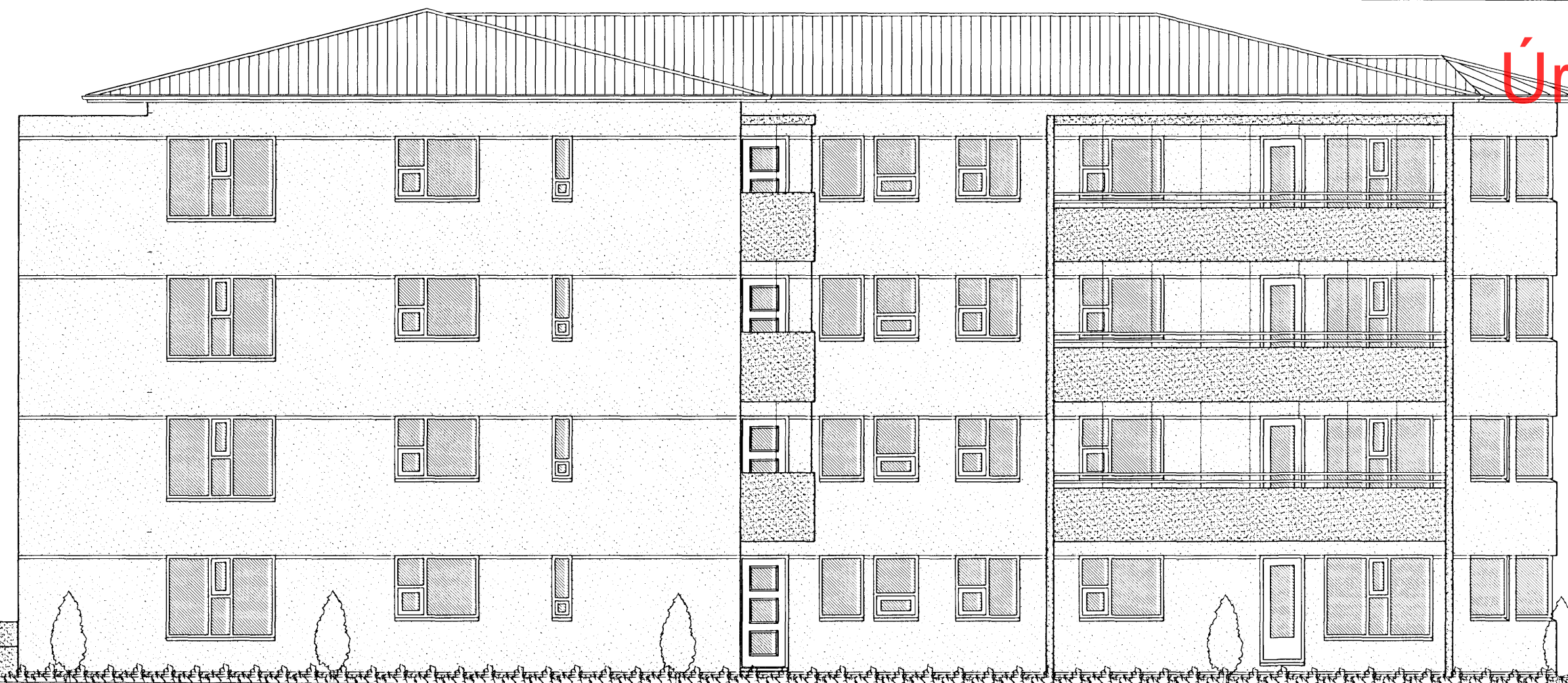
ÚTLIT SUÐUR MKV. 1:100.