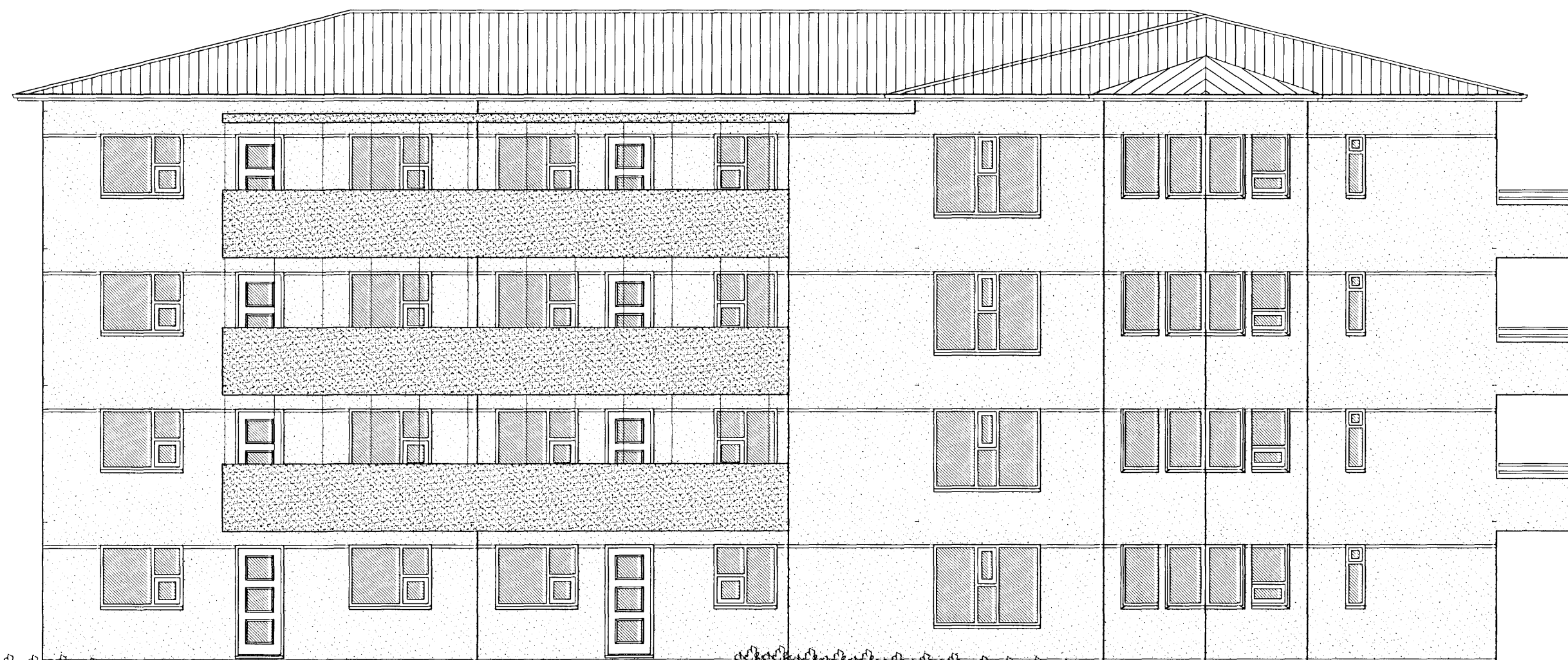
ÚTLIT AUSTUR MKV. 1:100.