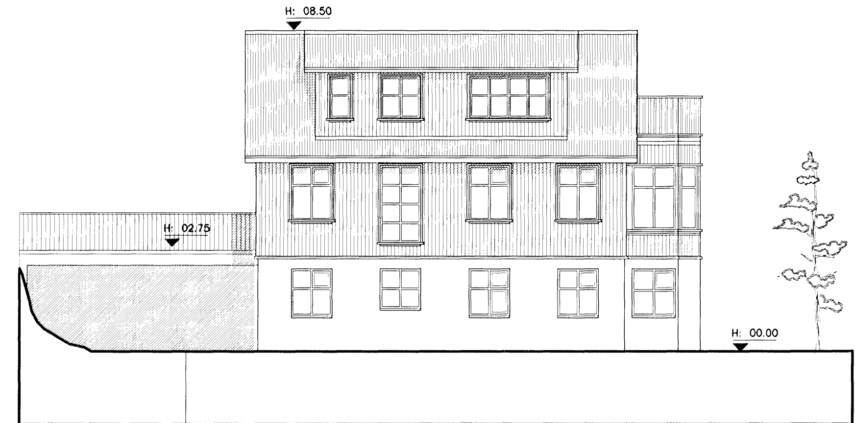
Ásýnd Norð-vestur mkv. 1:100

Samþykkt þann 7 MAR 2007 Byggingaálfurinn / Hljórnarfirði F.h. Jón Sigurðsson