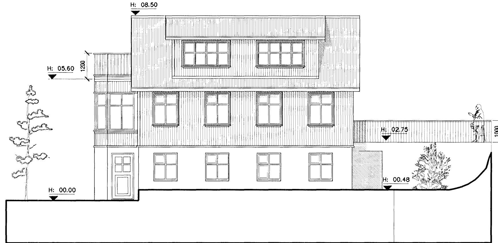
Ásýnd Suð-Austur mkv. 1:100