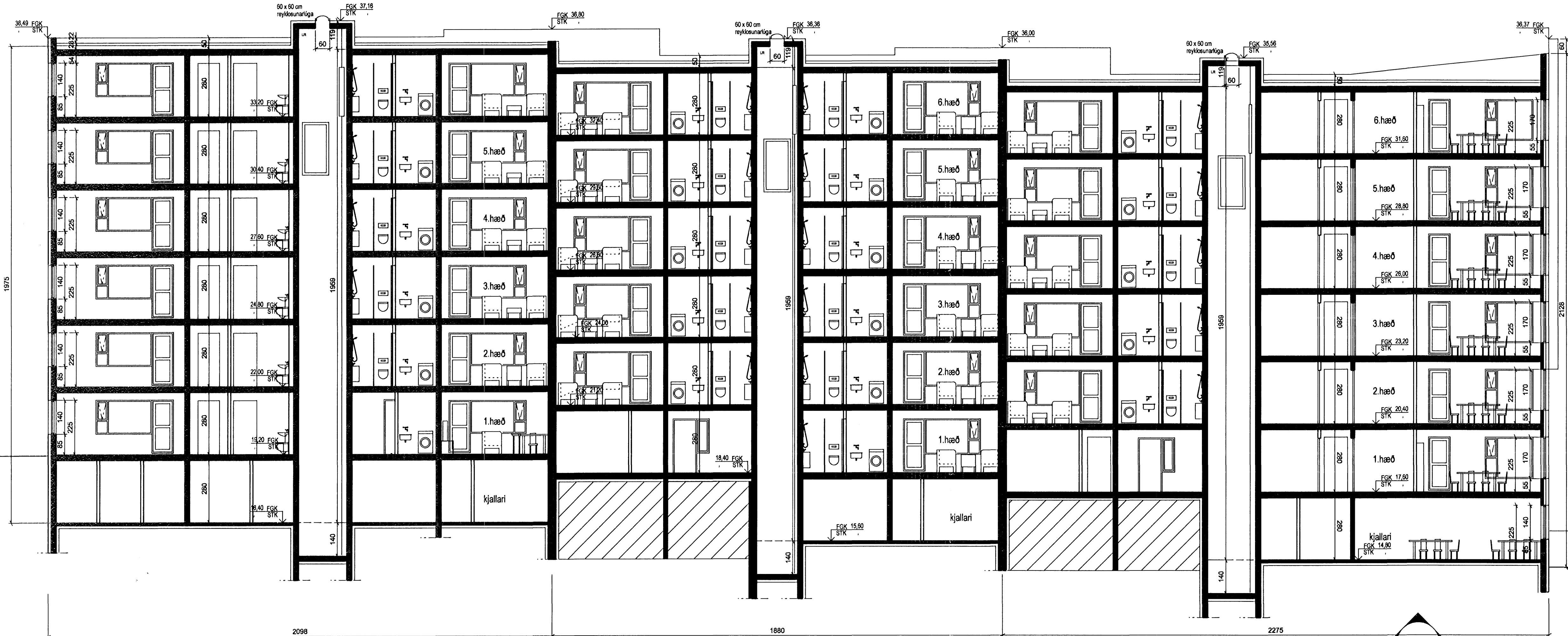
SNEIÐING 1:100 sníð B-B