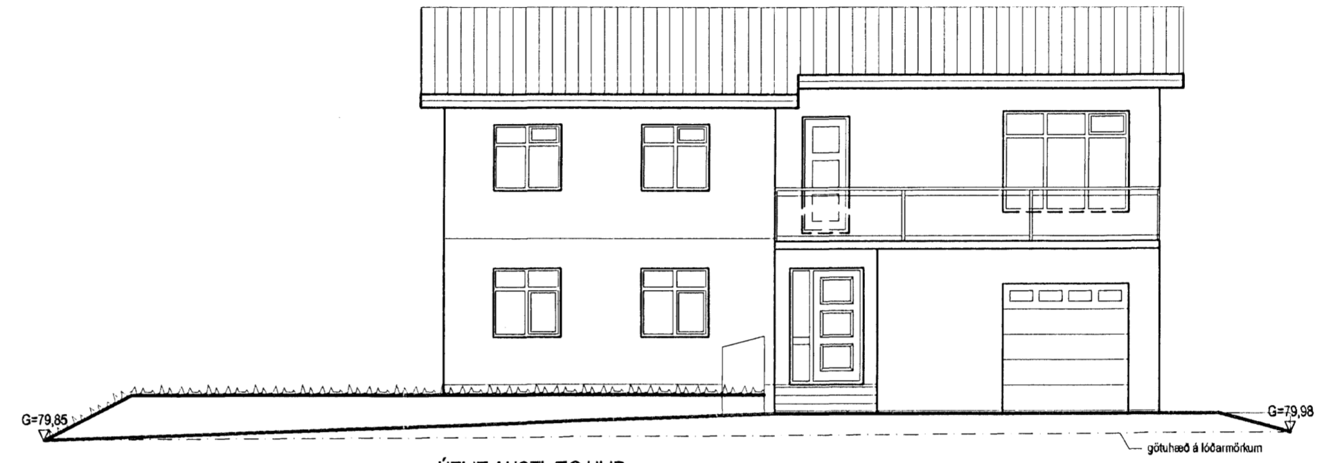
ÚTLIT AUSTLÆG HLIÐ