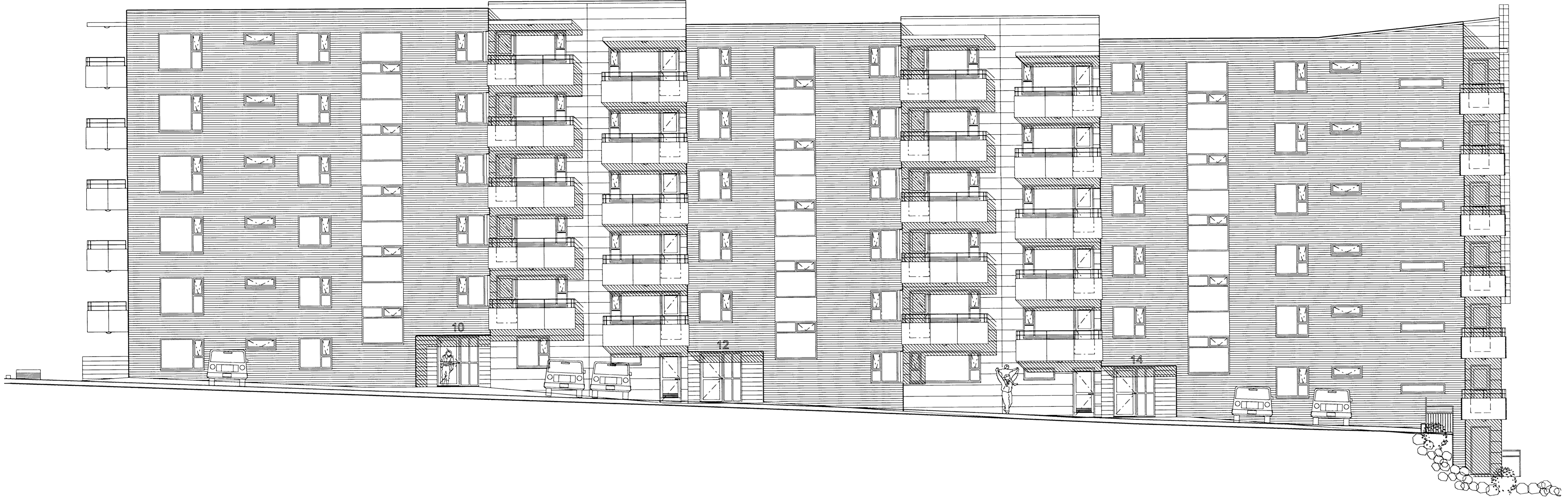
ÚTLIT 1:100 Norð-austur hlið

Byggingarfulltrúi samþykkt erindið. 25. JULÍ 2007 Bent skal á að samþykki þessi verður ekki virk, því er einn þingmaður eignaskiptasáttfangar- innar og skattgjafinnur hjá Kringinnamatí ríkisséð. Byggingarfulltrúinn í Hafnarfirði. F.h. Kristján Þórásson