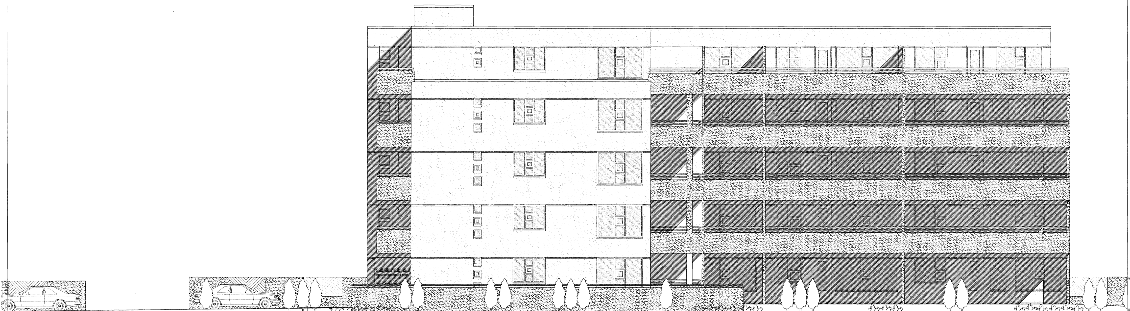
ÚTLIT SUÐUR MKV. 1:100.